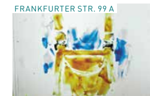
FRANKFURTER STR. 99 A

Ein Müllmann hat jeden Tag in der Frankfurter Str. 99A eine Verabredung: mit einer Katze. Gemeinsam verbringen sie die Mittagspause. Die Geschichte einer besonderen Freundschaft.