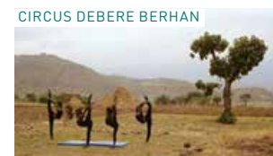
CIRCUS DEBERE BERHAN