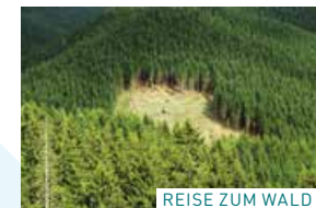
REISE ZUM WALD