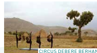
CIRCUS DEBERE BERHAN