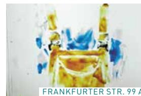
FRANKFURTER STR. 99 A